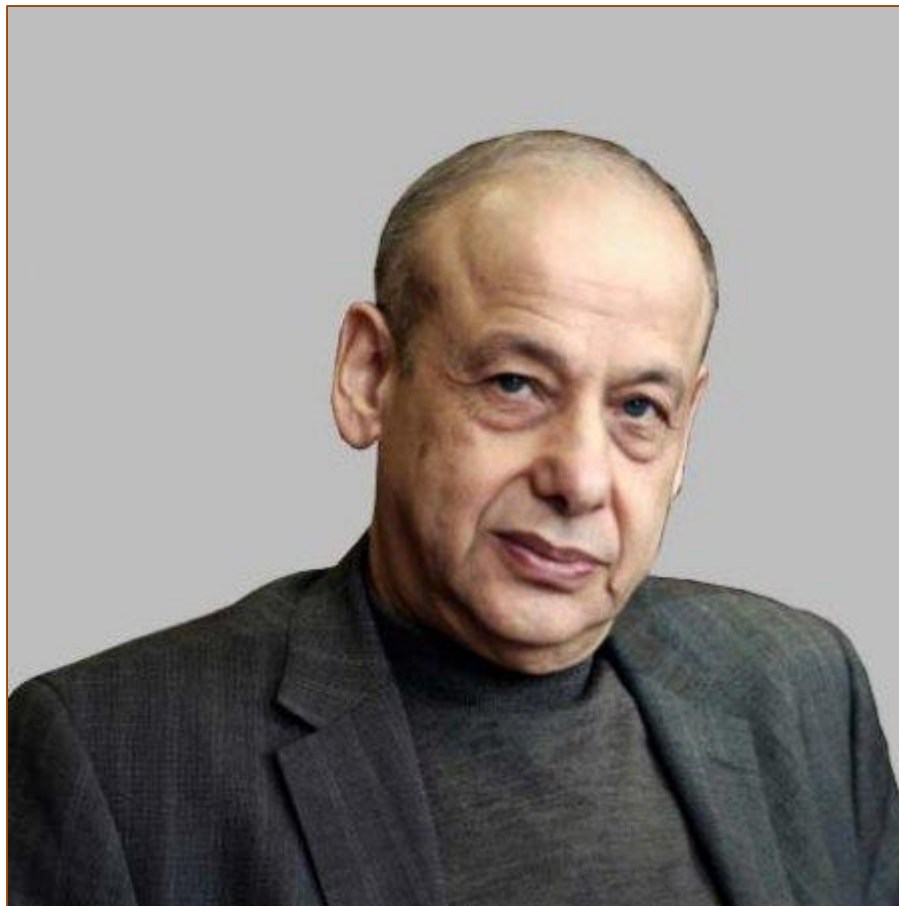
Александр Григорьевич Асмолов